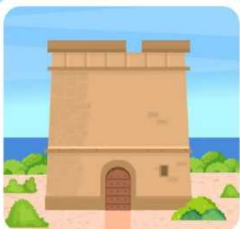
1.LA TORRE DE SA GUARDIOLA